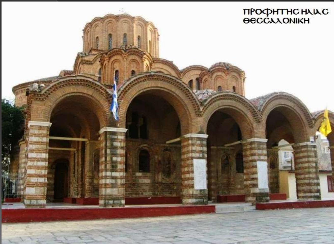
ΠΡΟΦΗΤΗΣ ΗΛΙΑΣ ΘΕΣΣΑΛΟΝΙΚΗ